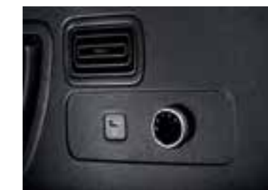
Ventilaciones de aire acondicionado de la 3ª fila con control de velocidad (3 etapas)

* Las características y especificaciones varían según el mercado. Consulte al distribuidor local.