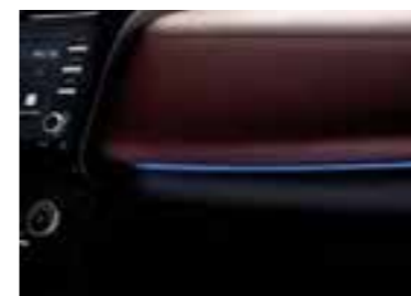
Luz de ambientación de 64 colores