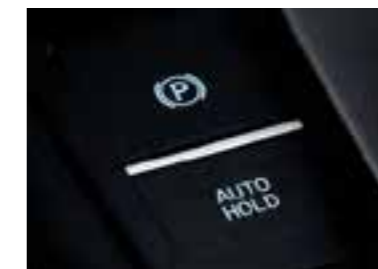
Freno de estacionamiento eléctrico con retención automática