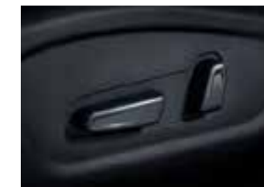
Asiento eléctrico de 8 posiciones para el conductor