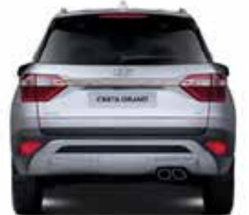
Banda de rodadura 1,564.3