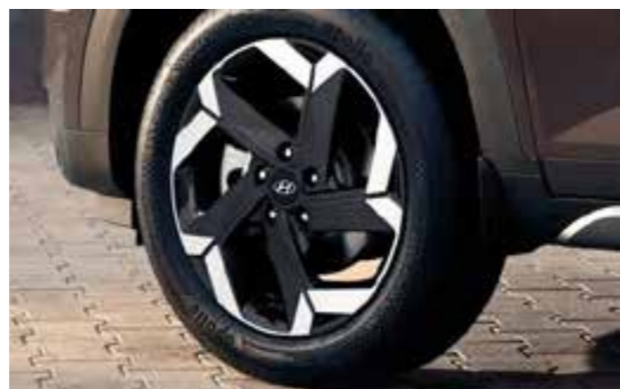
Faros delanteros LED con DRL de LED Llantas de aleación de 18" con corte de diamante