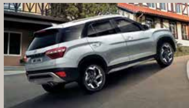
Asistente de control de arranque pendiente arriba (HAC)

El TPMS le ayuda a lograr una economía de combustible óptima y prolonga la vida útil de los neumáticos mediante una alerta si los neumáticos necesitan su atención.