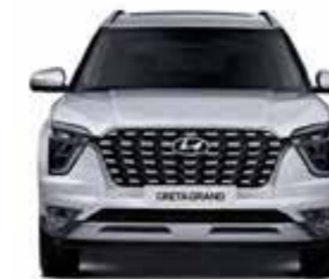
Ancho general 1,790 Banda de rodadura 1,595.5