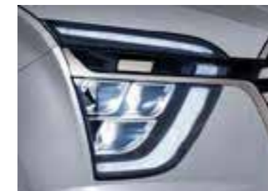
Faros delanteros antiniebla (MFR LED)