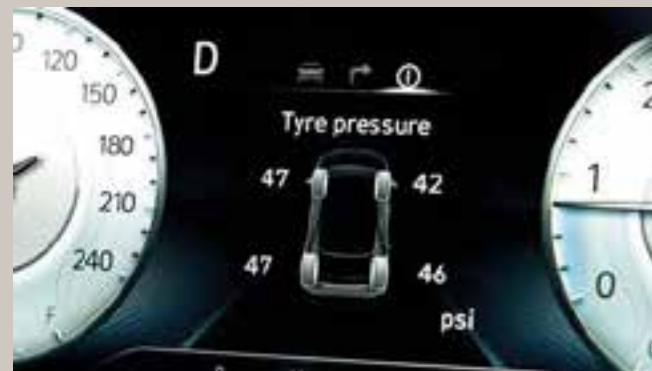
Sistema de monitoreo de presión de neumáticos (TPMS)

Aunque el camino por delante está lleno de incertidumbres, los sistemas de seguridad avanzados del CRETA GRAND le brindan una completa tranquilidad. Las zonas de absorción de impactos especiales sirven como su primera línea de defensa. Estas estructuras, hechas de acero de ultra alta resistencia a la tracción e insertadas en áreas críticas, están diseñadas para absorber de manera segura las fuerzas de impacto y proteger a los ocupantes de la cabina en caso de un choque. El monitor de vista de punto ciego siempre examina por encima del hombro y le avisará si intenta hacer un cambio de carril inseguro.