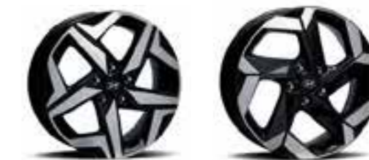
Llantas de aleación de 17"