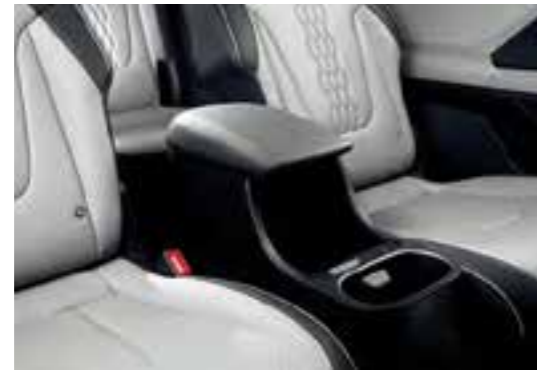
Caja de consola de 2ª fila (6 plazas)

El espacioso compartimento de equipaje se adapta a casi cualquier cosa. Y si no entra, puede triplicar fácilmente el espacio de almacenamiento con el pliegue de los respaldos de la 2ª y la 3ª fila: es tan fácil, como contar hasta 3. ¡Eso sí que es versátil!