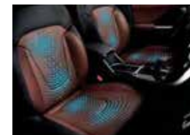
Asientos delanteros ventilados