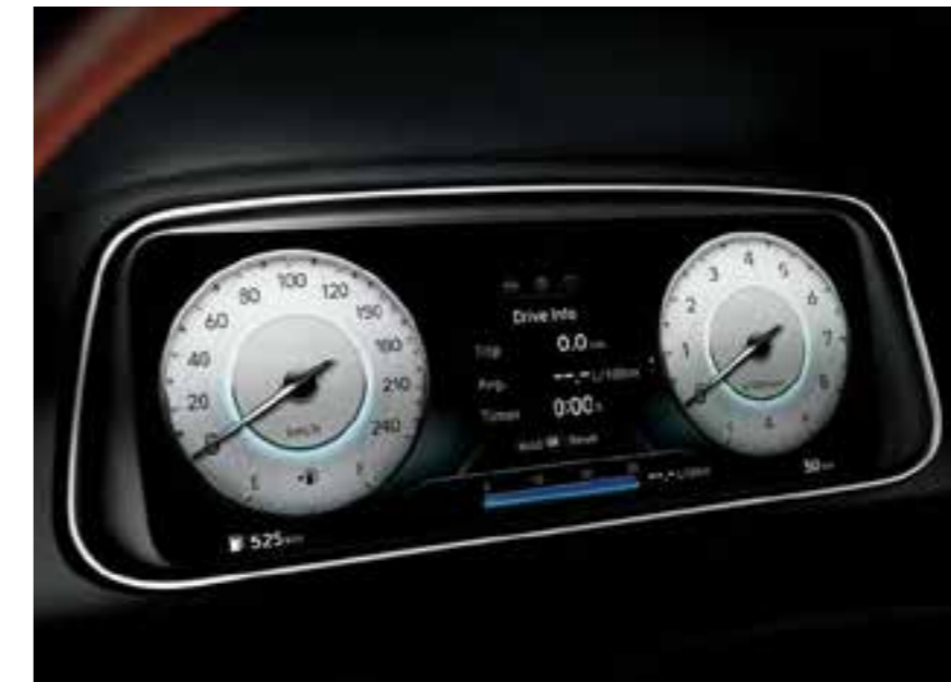
Tablero LCD de TFT de 10.5"