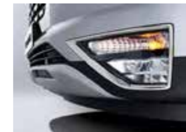
Faros delanteros antiniebla (MFR)