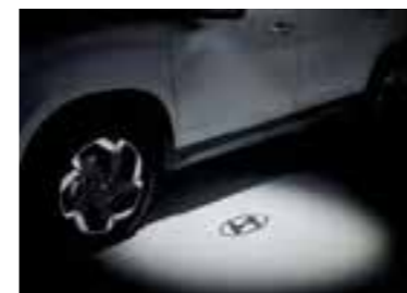
Luz para charcos con proyección de logotipo Hyundai