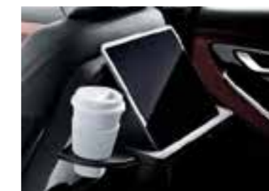
Mesa de respaldo en la fila delantera con portavasos retráctil y soporte para dispositivos informáticos