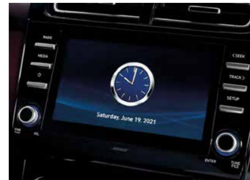
Pantalla táctil de 8"