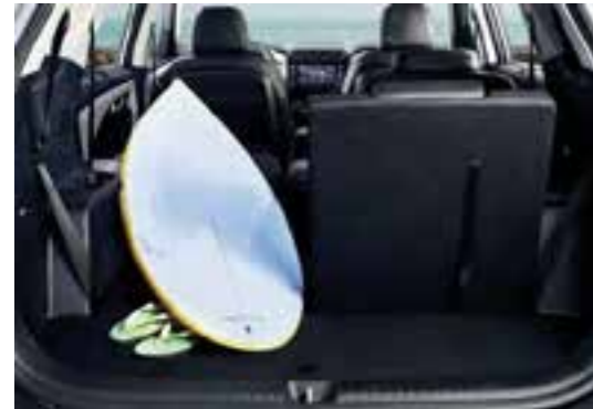
Compartimento de equipaje espacioso y versátil

El espacioso compartimento de equipaje se adapta a casi cualquier cosa. Y si no entra, puede triplicar fácilmente el espacio de almacenamiento con el pliegue de los respaldos de la 2ª y la 3ª fila: es tan fácil, como contar hasta 3. ¡Eso sí que es versátil!