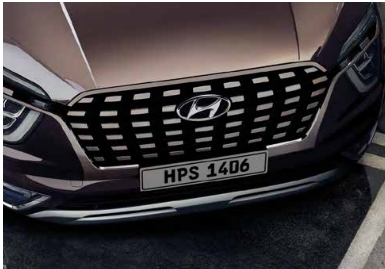
Parrilla en cascada característica de cromo oscuro

Moderno, deportivo y masculino: simplemente es mi estilo, está en perfecta sintonía con mi sensibilidad y encaja en cualquier lugar. Desde cualquier ángulo, el CRETA GRAND proyecta suprema confianza y autoridad. Su fascinación solo aumenta a medida que se acerca para examinar los detalles: La iluminación LED, las llantas de aleación con corte de diamante de diseño llamativo y la parrilla del radiador de aspecto llamativo. Pero el verdadero centro de atención y placeres aún mayores lo esperan en el interior.