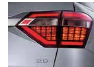
Luces LED traseras combinadas