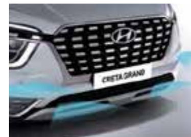
Advertencia de distancia delantera