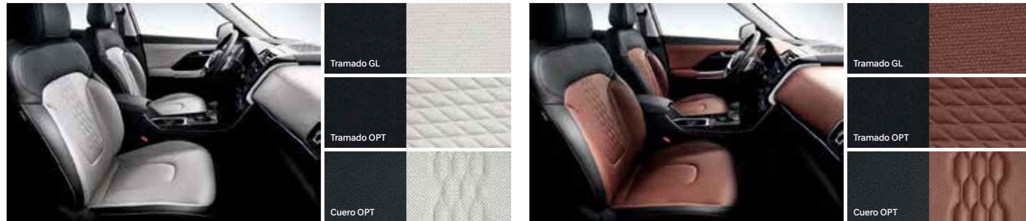
Interior en dos tonos Negro/Gris