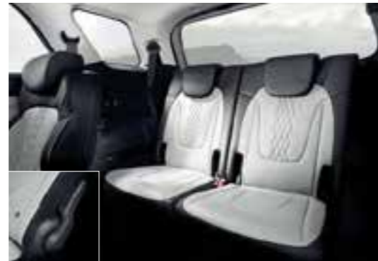
Sistema de plegado de asientos de 2ª fila y 3ª fila

La caja de la consola central altamente versátil sirve tanto como un acolchado reposabrazos, una práctica bitácora de almacenamiento y viene con un cargador de teléfono y portavasos dobles integrados.