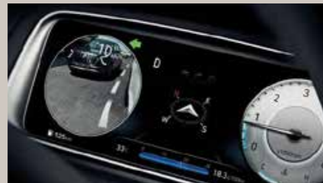
Monitor de punto ciego (BVM)

El CRETA GRAND cuenta con 6 airbags: el conductor y el pasajero delantero tienen un par de airbags delanteros más un par de airbags laterales para proteger el tórax y las áreas pélvicas, mientras que los airbags tipo cortina izquierda y derecha ofrecen protección para la cabeza de todos los ocupantes de la cabina.