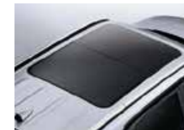
Techo corredizo panorámico