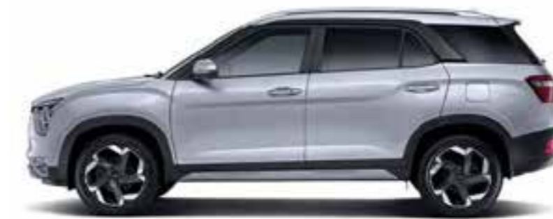
Longitud general 4,500 Distancia entre ejes 2,760