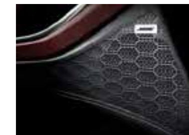
Sistema de audio Bose de calidad superior