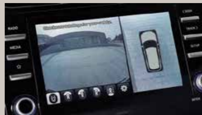
Monitor de vista periférica (SVM)

Cuando se activan las luces de giro, la imagen de la parte trasera de la dirección correspondiente se muestra en el tablero.