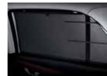
Cortina manual de puerta trasera