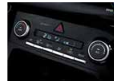
Controles de temperatura totalmente automáticos