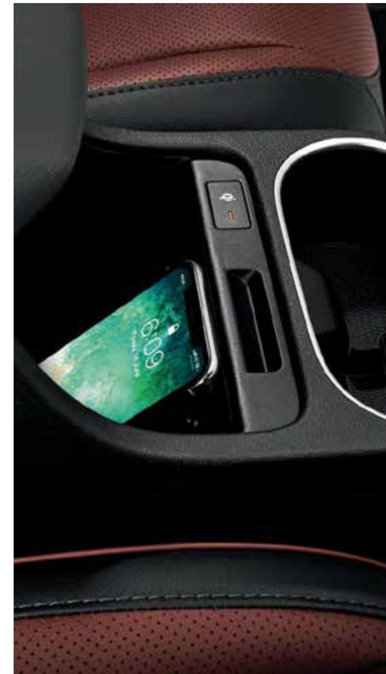
Cargador de teléfono inalámbrico de 2ª fila