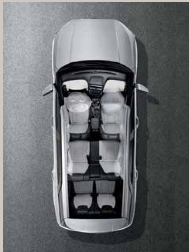
Sistema de 6 airbags (conductor, pasajero, lateral y tipo cortina)

Cuando se arranca luego de estar detenido en una colina, el HAC evita el retroceso involuntario que se puede producir después de soltar el pedal de freno.